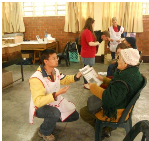
Los oculistas extranjeros examinaron a unos 3000 pacientes en el Colegio fe y Alegría.

taller de costura). Esta tarea gigantesca ha demandado un esfuerzo extra para acoger a todas las familias que reciben sus anteojos, en particular los ancianos. Hubo colas desde la medianoche para poder obtener tickets de atención. El colegio entero ha asumido esta tarea con mucho interés y se han coordinado muchos esfuerzos de los padres de familia, amigos, los Hermanos de la Comunidad de Las Flores y nuestros propios trabajadores del colegio. Se escucha permanentemente una mezcla de español, inglés y francés en nuestra escuela: ouvrez vos yeux s'il vous plaît...right ojo, please.