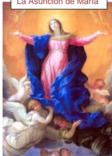
La Asunción de María