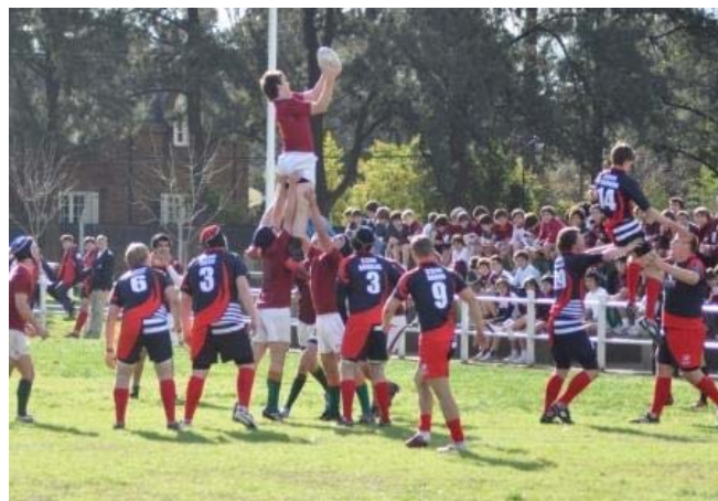
La selección de rugby de Newman les dio una buena lección a los ingleses del arte de jugar rugby en Argentina.

Siguen los talleres de comunicación y afectividad para toda la secundaria. La idea es generar un espacio dónde los chicos puedan compartir su vida y escucharse entre sí para poder conocerse más a uno mismo y a los demás.