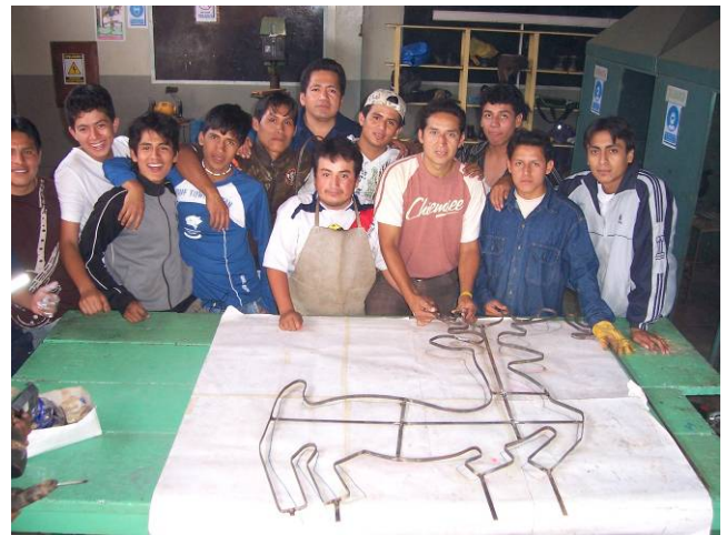
Construcciones Metálicas con uno de sus diseños navideños hecho en acero; sólo falta el Papá Noel.