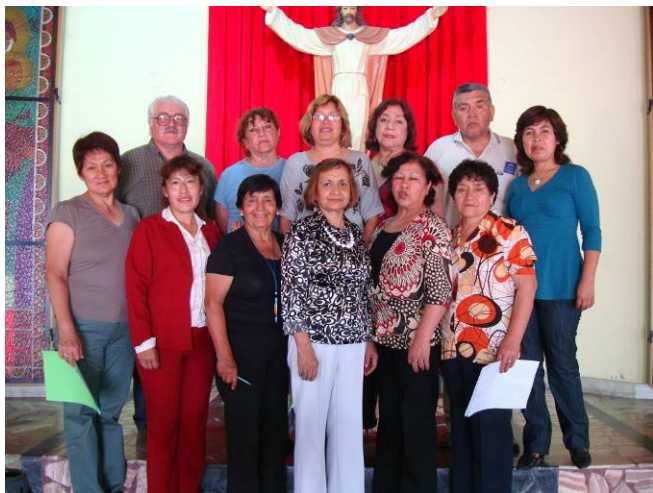
Los Asociados chimbotanos—anfitriones de la Asamblea en enero en el balneario de Tortugas.