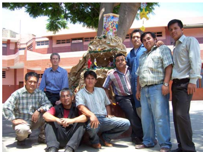
Profesores del Centro Técnico alrededor del nacimiento.